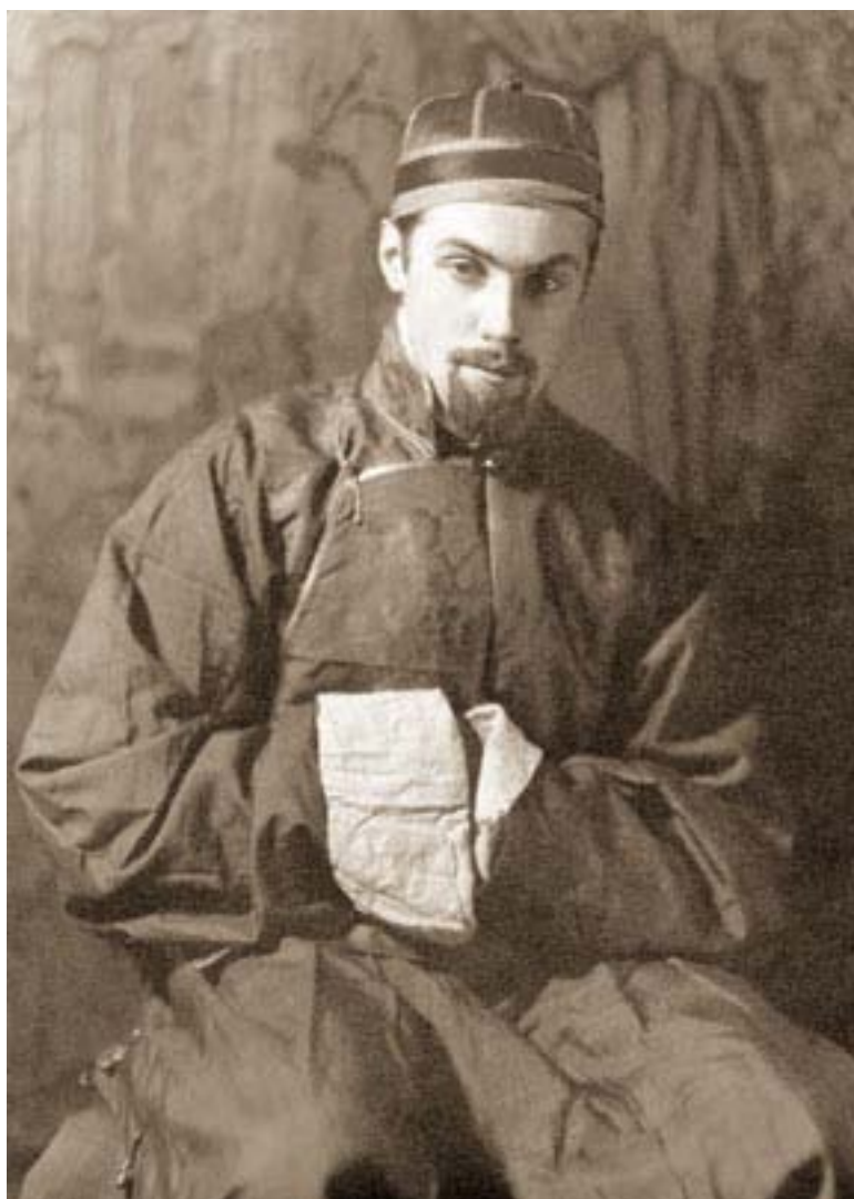
Святослав Рерих. Дарджилинг, 1924 Фотография, сделанная для работы над автопортретом