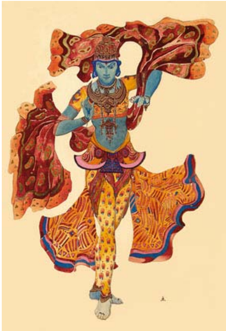
Святослав Рерих. Индийский костюм Нью-йоркская публичная библиотека. Коллекция танцев