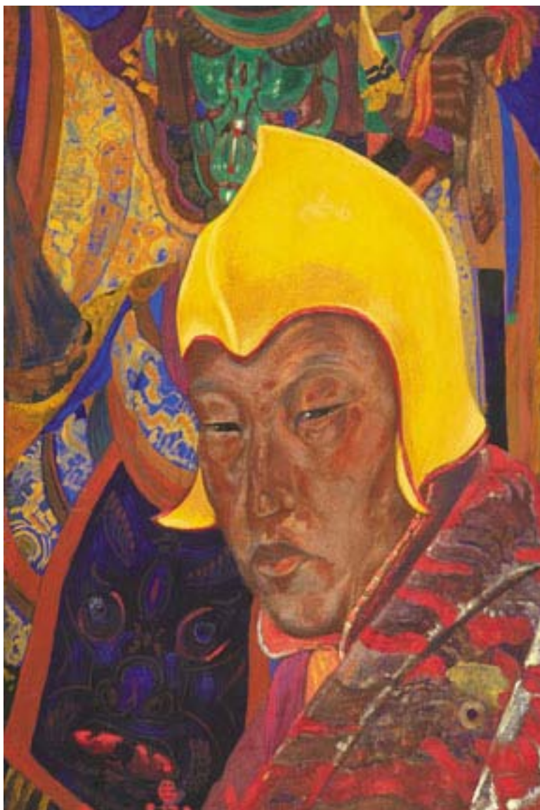
Святослав Рерих. Лама. 1923 Музей Николая Рериха, Нью-Йорк