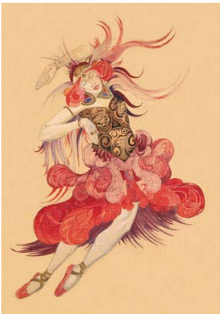
Святослав Рерих. Птица. Эскиз костюма Нью-йоркская публичная библиотека. Коллекция танцев