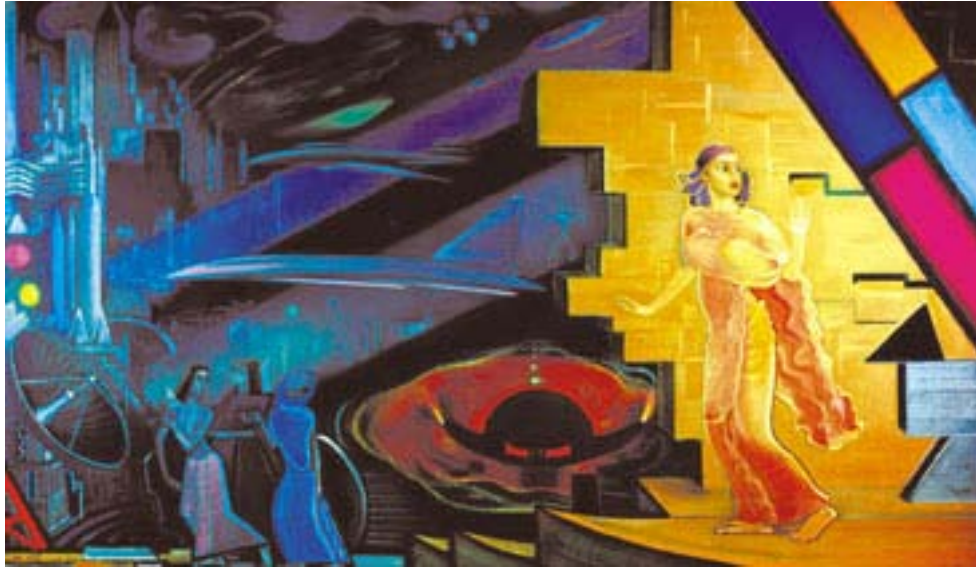
С.Н.Рерих. Я двигаюсь среди этих теней. 1967 Государственный музей Востока, Москва