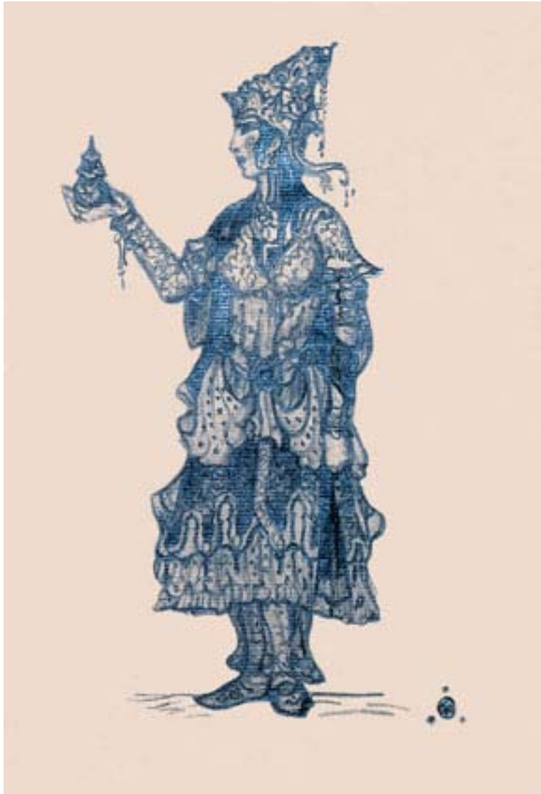
Святослав Рерих. Королева Кораллов Нью-йоркская публичная библиотека. Коллекция Руфь Пейдж