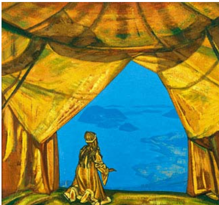
Н.К.Рерих. Властитель ночи. 1918 Музей Николая Рериха, Нью-Йорк

Дягилевском стиле, но снабжено новыми эффектами».* Наибольший интерес в сценарной разработке вызывает описание декораций. Подробно выписаны элементы быта, одежда и архитектурные постройки. Однако самое интересное состоит в том, что сценарий этот кажется автобиографичным. Костюм Снежинки Святослав Рерих посылает Руфь Пейдж в Америку. Он любит танец, любит само движение. Он чувствует себя одиноким в этом холодном мире.