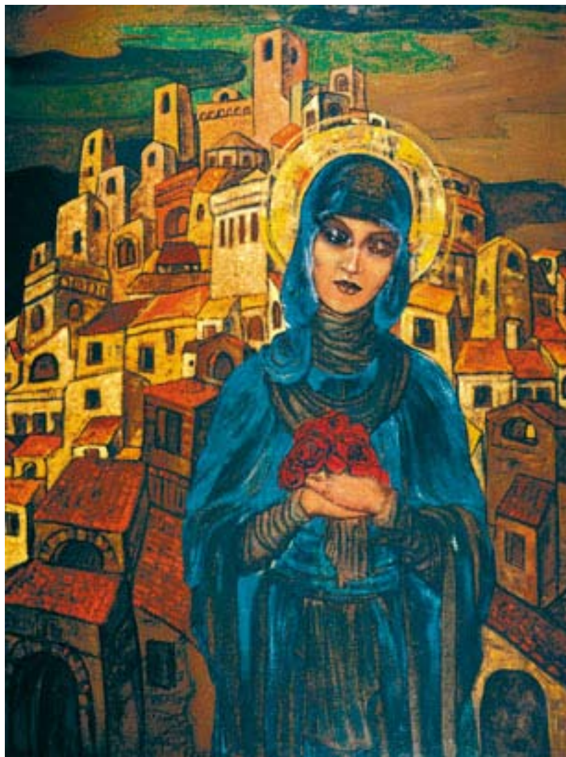
Святослав Рерих. Розы сердца. 1923 Музей Николая Рериха, Нью-Йорк