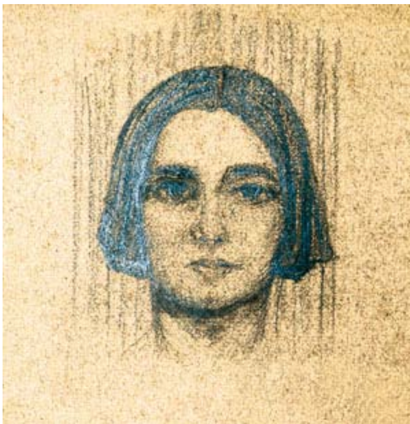
Святослав Рерих. Портрет Руфь Пейдж. 1923 Нью-йоркская публичная библиотека. Коллекция Руфь Пейдж

направления в моей работе... Сценические костюмы, портреты и иллюстрации».* И хотя театр стоит на первом месте, немаловажное значение уделяется искусству портрета. Оставим пока в стороне увлечение иллюстрацией, этой темы придется коснуться ниже. Что же касается портретной работы, то, по оценке Святослава Рериха, она является «основной линией». Из Индии художник мечтает приехать знаменитостью: «Я вернусь обратно как лучший портретист».** Художественные амбиции, похоже, подкреплялись и собственным талантом, и хорошим знанием современного искусства. Святослав Рерих, будучи в Европе, подробно изучал живопись старых мастеров (особенно итальянцев: Беллини, Боттичелли, Тициана). А новых